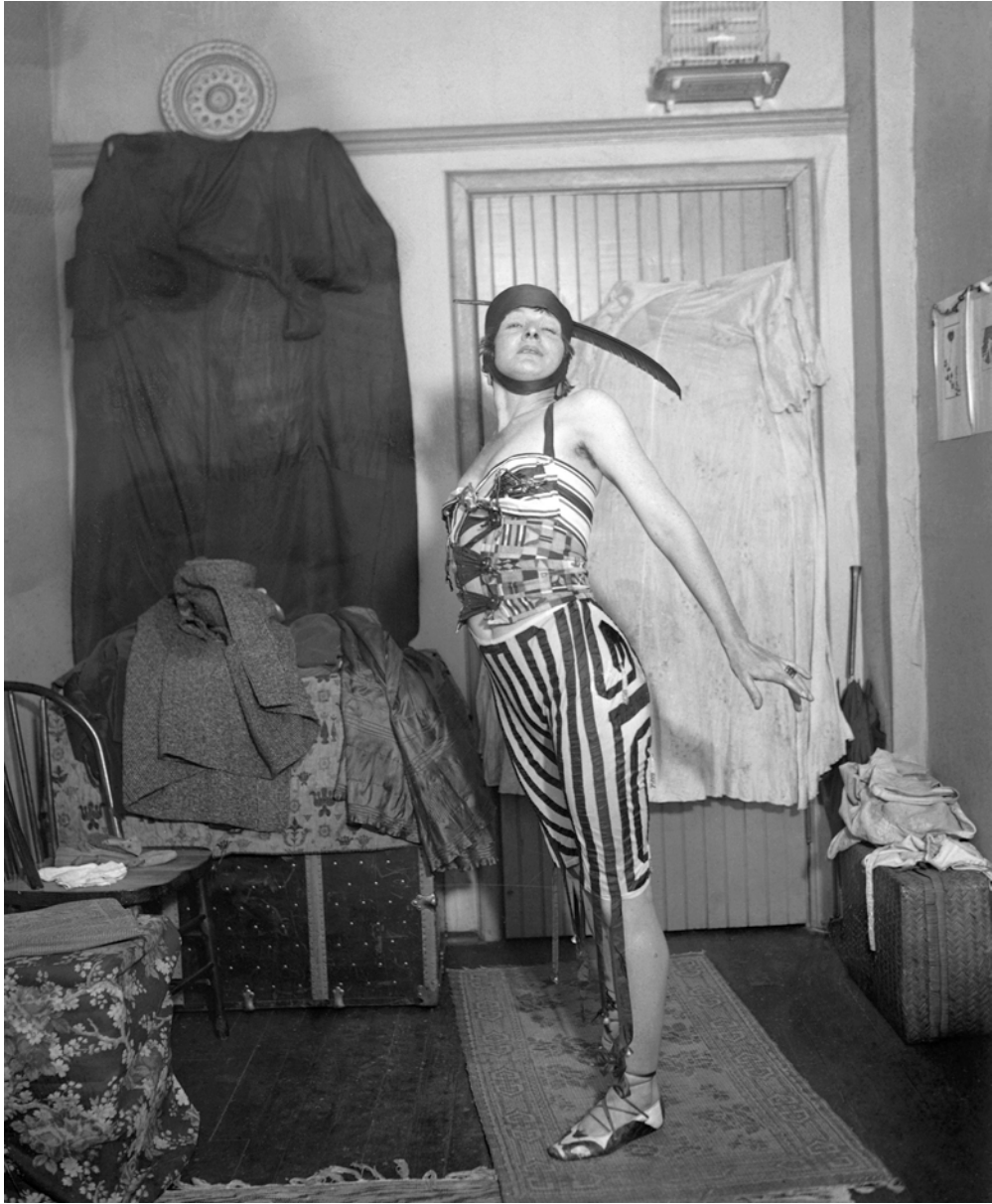
Elsa von Freytag-Loringhoven (New York, 1915)