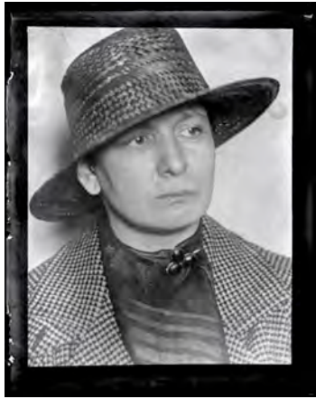
Elsa von Freytag-Loringhoven