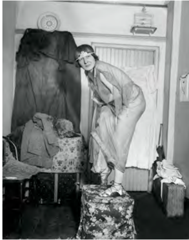
Elsa von Freytag-Loringhoven (1915)